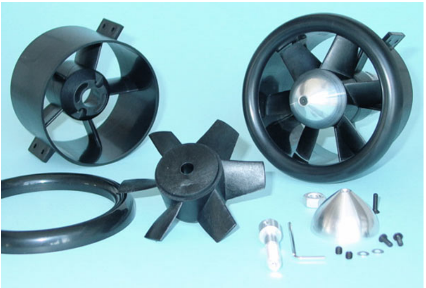
Abb. 4: Einzelkomponenten und montierter Midi Fan Pro von WeMoTec

Der Motorträger wird über den Stator mit dem Impellermantel verbunden. Der Stator hat aber auch eine sehr wichtige aerodynamische Aufgabe. Die im Impeller vom Rotor nach hinten strömende Luft hat nicht nur eine rein axiale Luftströmung, sondern auch einen rotierenden Anteil. Die Aufgabe des Stators mit seinen Leitflächen, die ähnlich wie ein Rotorblatt geformt sind, ist diese rotierende Luftströmung wieder axial auszurichten. Er trägt damit nicht unerheblich zum Gesamtschub bei. Bei einigen Impellern wird der Stator auch dazu genutzt die Motorkabel aerodynamisch zu verkleiden. Bei andern Impellern erfolgt dies über eine spezielle Strömungsverkleidung für die Motorkabel.