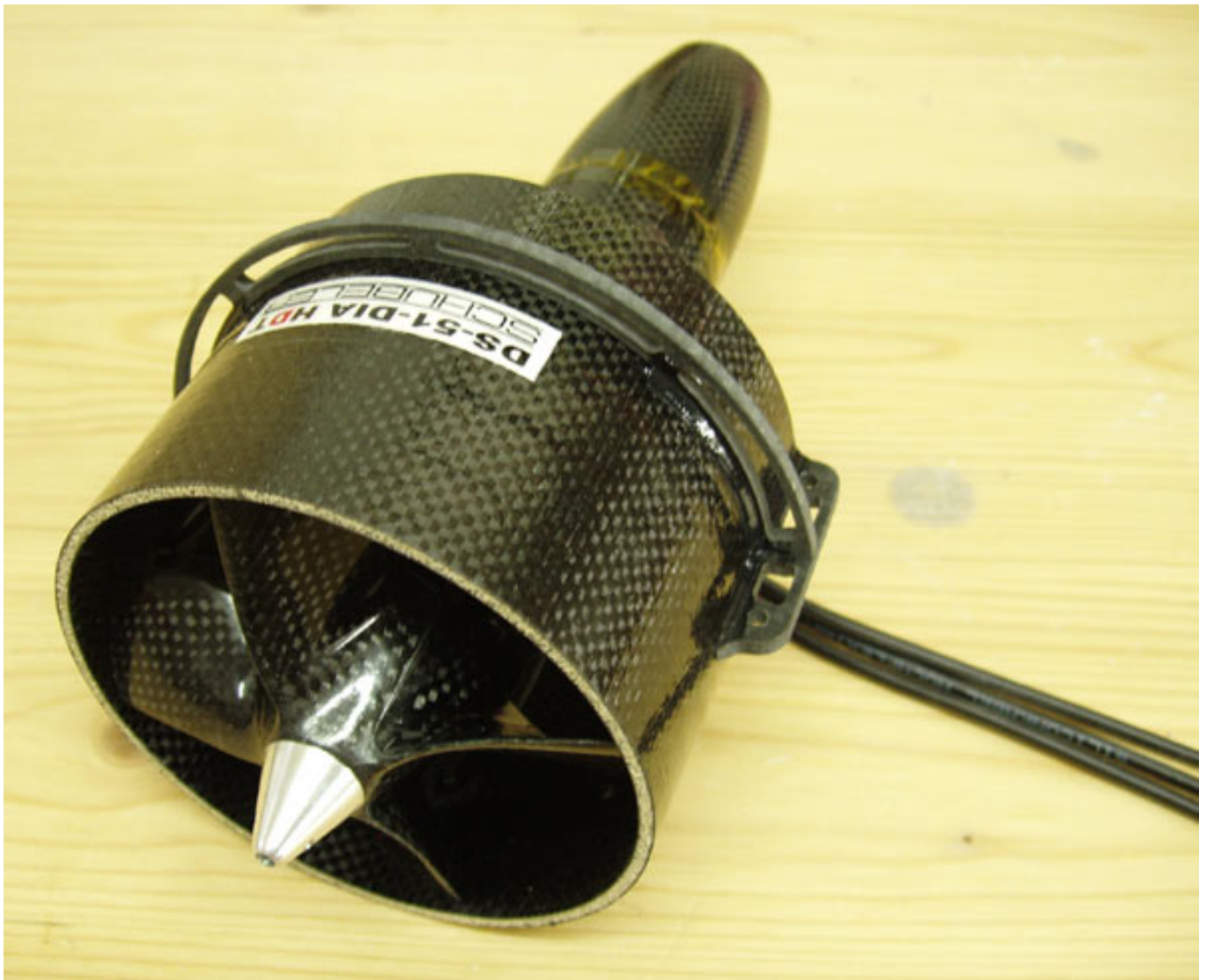
Abb. 2: fertig montierter Schübebler DS-51-DIA HDT

Angetrieben wird der Rotor von einem Elektromotor. Der Rotor wird über einen Mitnehmer, der auf der Rückseite innen in dem Rotor steckt, mit der Motorschnecke verbunden. Die Achse wird mit einer Schraube befestigt, wie man das von einem Propeller her kennt. Der Motor selbst steckt in einem Motorträger, der sogenannten Narbe. Auf der Narbe sitzt ein konisch zulaufender Strömungskörper zur aerodynamischen Optimierung des Übergangs von Motor in den Strömungskanal. Der Optimierungseffekt ist allerdings nicht sehr groß, so dass sich auch Impeller ohne Strömungskörper bei nur geringem Leistungsverlust einsetzen lassen.