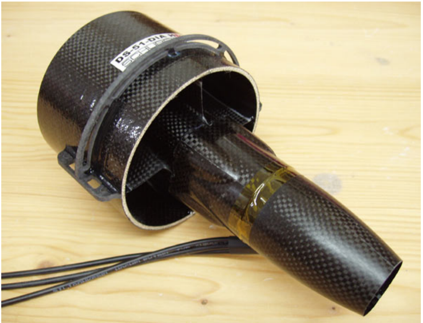
Abb. 3: Strömungskörper des DS-51-DIA HDT

Wichtig ist auch, dass der Spalt zwischen dem Rotorblättern und dem Impellermantel so klein wie möglich ist. Damit wird verhindert, dass die Druckdifferenz vor und hinter dem Rotor sich über dieses Spalt ausgleichen kann. Der Spalt ist in der Regel kleiner als ein halber Millimeter. Es gibt auch Impeller, bei denen die der Rotors bewusst so groß ist, dass er leicht an dem Impellermantel schleift. Entweder man lässt ihn einfach einschleifen bis der Spalt groß genug ist oder man hilft mit sehr feinem Sandpapier nach und schleift die Rotorspitzen solange an, bis keine Berührung von Rotorblättern und Impellermantel festgestellt werden kann.