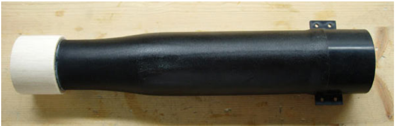
Abb. 7: Düse (28 cm) von WeMoTec mit Mini Fan pro, vorbereitet für den Einbau in einer HET Mig-15