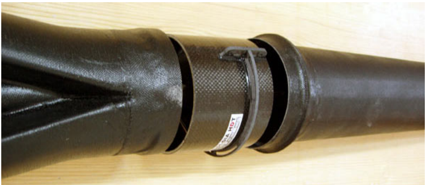
Abb. 6: Luftführung mit Hosenrohr (links), DS-51-DIA HDT Impeller (mitte) und Düse (rechts)

Die Düse hinter dem Impeller verengt sich zum Abschluss hin und die Luft beschleunigt sich dadurch. Mit kleiner werdender Düse wird die Strahlgeschwindigkeit also erhöht und gleichzeitig der Standschub gemindert.