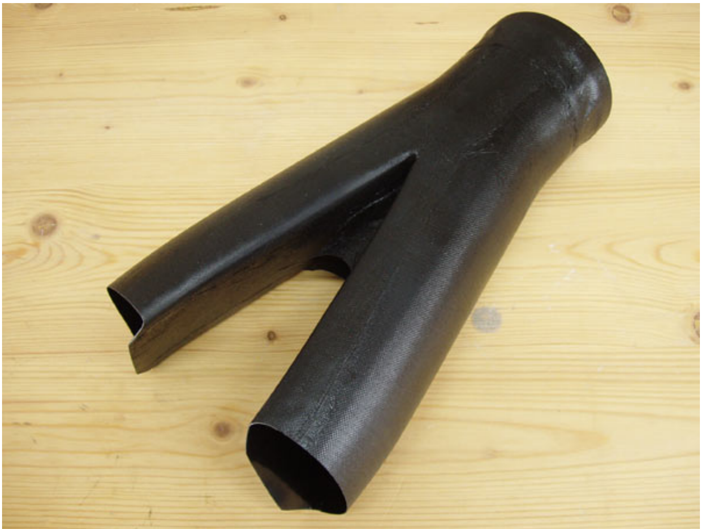
Abb. 5: Hosenrohr für eine SAVEX L-39

Bei Schaummodellen ist häufig der ganze Luftkanal durch den Schaum geformt und nach dem Impeller wird die Wandung mit einer Folie ausgekleidet. Bei Holz- oder GFK-Modellen sind Einlauf und Düse als GFK- oder CFK-Komponenten ausgeführt, die in den Rumpf eingebaut werden und so die Luftführung vorgeben. Bei vielen Originalen gibt es zwei Einlauföffnungen. Bei den Modellen mit zwei Einläufen und einem Impeller-Triebwerk kommt als Einlauf ein sogenanntes Hosenrohr zum Einsatz, welches die beiden Luftströme zusammenführt.